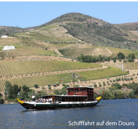
Schiffahrt auf dem Douro

Fahrt nach Amarante , einer malerisch auf beiden Seiten des Flusses Tamega gelegenen Stadt. Besichtigung der Klosterkirche Sao Goncalo und der dreibogigen Brücke aus dem 18. Jh.. Von hier aus geht es nach Pinhao zu einer ca. zweistündige Schiffahrt auf dem Douro-Fluss bis nach Tua. Dies ist der interessanteste Abschnitt des Douro-Tals und führt vorbei an Weinbergen und beeindruckenden Landschaften. Die Douro-Region ist UNESCO-Weltkulturerbe. Hier wird seit fast 2000 Jahren Wein angebaut.