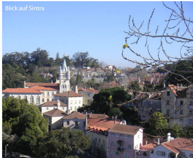
Blick auf Sintra

Deutsche Staatsbürger benötigen für die Einreise nach Portugal einen Personalausweis oder Reisepass , der mindestens für die Dauer des Aufenthalts gültig sein muss. Impfungen sind nicht vorgeschrieben. Diese Reise ist für Menschen mit eingeschränkter Mobilität nicht geeignet. Fragen Sie uns im Bedarfsfall nach Möglichkeiten der Teilnahme.