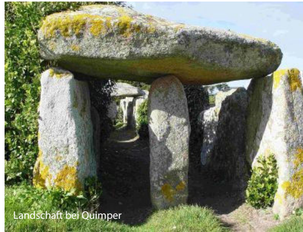
Landschaft bei Quimper

Festungsanlagen. Fahrt in Richtung Westen und kurzer Stopp in Dinan mit seinem hübschen historischen Stadtkern. Weiterfahrt in Richtung Cap Fréhel. Wanderung entlang der ‚Smaragdküste‘, die eine der schönsten Landschaftsbilder der Bretagne mit tief einge-