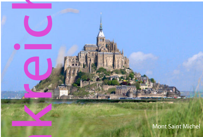
Mont Saint Michel

3. Tag: Anflug zur befestigten Abtei von Mont-Saint-Michel, das sog. „Wunder des Abendlandes“. Besichtigung der berühmten Kirche, des gotischen Kreuzgangs und der Prunksäule. Anschließend Spaziergang durch die einzige Straße des Mont-Saint-Michel und rund um den Inselberg. Weiterfahrt nach Cancale zum Besuch der Austernzuchtanlagen mit Kostprobe und zurück nach St. Malo. Besuch des Gezeitenkraftwerks und der Stadt. Abendessen und Übernachtung in St. Malo.