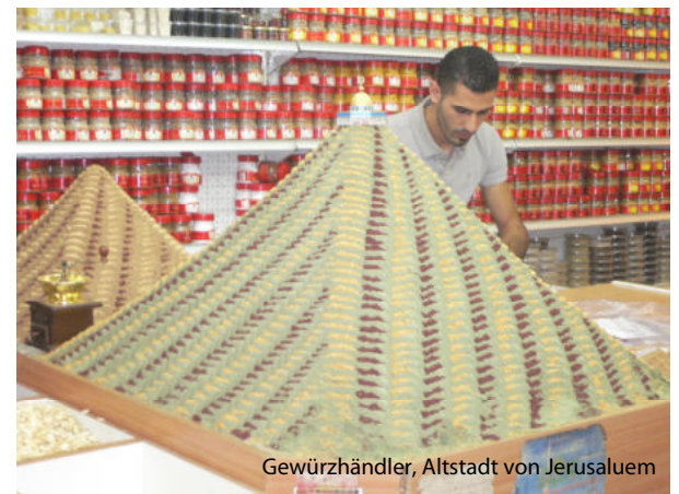
Gewürzhändler, Altstadt von Jerusalem

Fahrt durch das Jordantal nach Beth Shean , dem ehemaligen Skytopolis, einst die größte römisch-byzantinische Stadt im Nahen Osten. Von hier aus geht es weiter nach Beth Alpha, wo die wunderschöne alte Synagoge besucht wird. Weiter geht es zum einem Nationalpark, der bei den Israelis als Naherholungsgebiet sehr bekannt und beliebt ist. An den warmen Quellen im Naturpark Gan HaShloscha steht die Zeit zur freien Verfügung. Von hier aus geht es zurück. Abendessen und Übernachtung am See Genezareth .