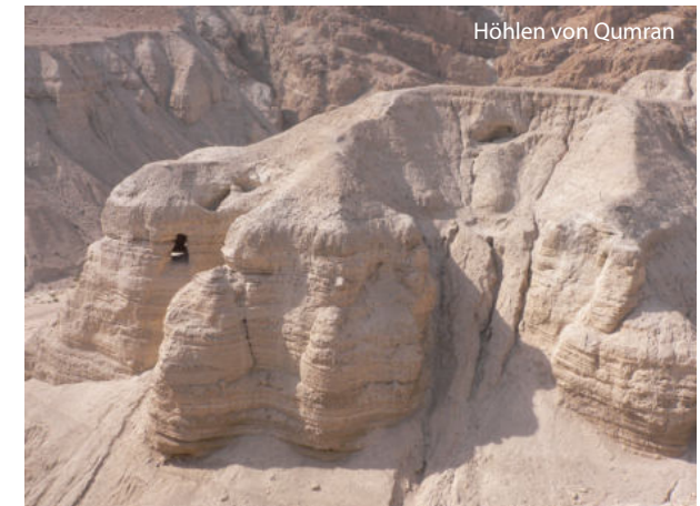
Höhlen von Qumran