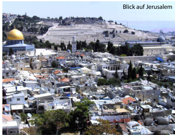
Blick auf Jerusalem

Fahrt nach Safed, eine der vier heiligen Städte Israels. Gang durch das Künstlerviertel und Besuch von zwei Synagogen. Weiterfahrt in das wasserreiche Gebiet der Quellflüsse des Jordan, Dan und