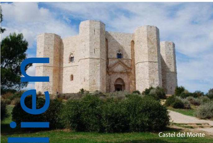
Castel del Monte