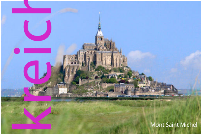
Mont Saint Michel

2. Tag: ca. 120 km Fahrt zum Mont-Saint-Michel, dem geographischen und gleichzeitig kulturellen Höhepunkt des französischen Westens. Führung durch die Kirchenburg, das sog. ‚Wunder des Abendlandes‘, oder auch ‚spiritueller Gipfel des Abendlandes‘, mit der berühmten Kirche, dem gotischen Kreuzgang und den Prunksälen. Anschließend Spaziergang durch die einzige Straße des Mont-Saint-Michel. Im Anschluss Fahrt über Cancale mit den Austernparks und Rot-