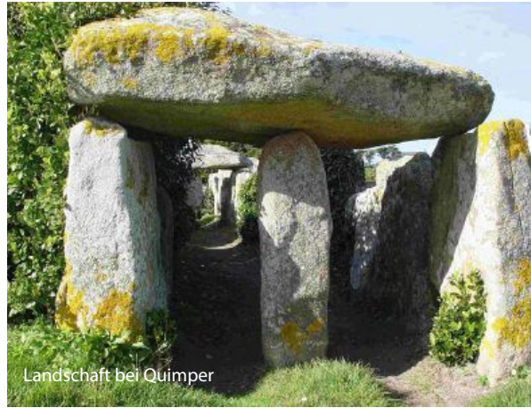
Landschaft bei Quimper

3. Tag: ca. 350 km Fahrt entlang der Küstenstraße zum Cap Fréhel. Die ‚Smaragd-küste‘ bietet einige der schönsten Landschaftsbilder der Bretagne