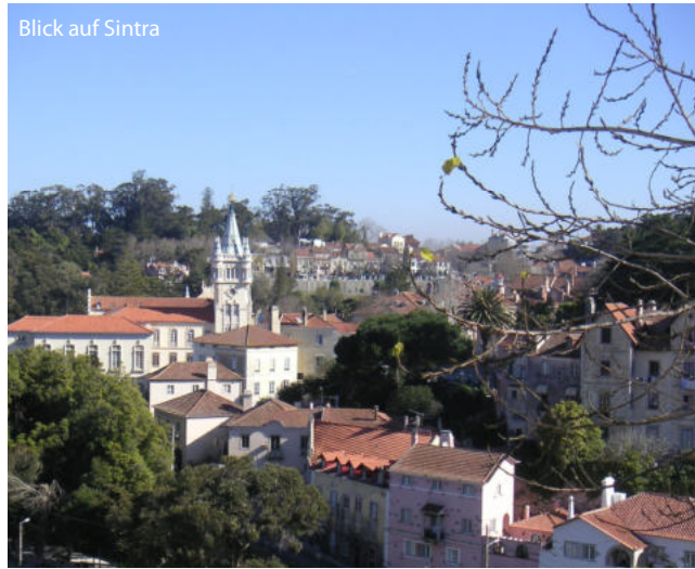
Blick auf Sintra

Mindestteilnehmerzahl: 21 Personen Sollte die Mindestteilnehmerzahl nicht erreicht werden, kann der Veranstalter bis spätestens 30 Tage vor Reisebeginn vom Reisevertrag zurücktreten.