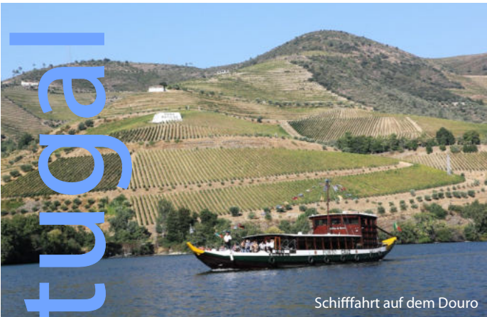
Schiffahrt auf dem Douro