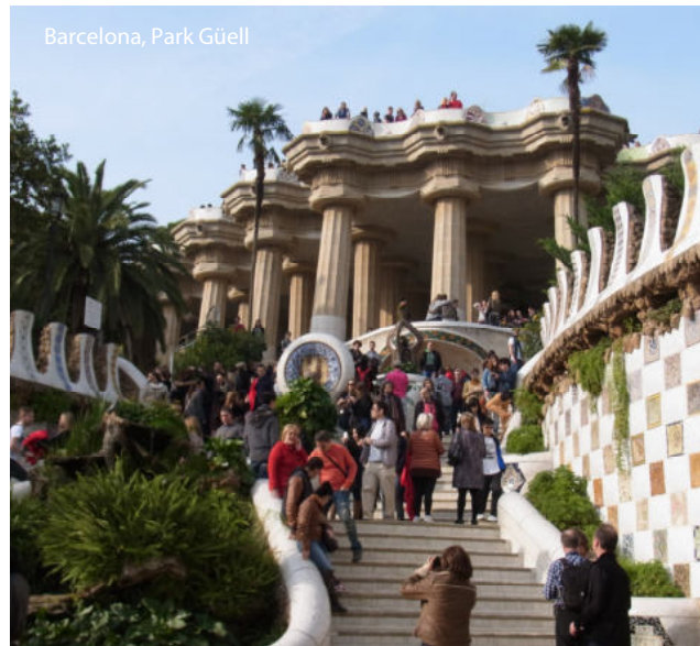
Barcelona, Park Güell

Diese Reise ist für Menschen mit eingeschränkter Mobilität nicht geeignet. Fragen Sie uns im Bedarfsfall nach Möglichkeiten der Teilnahme.