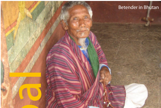
Betender in Bhutan

Frühmorgens Gelegenheit zu einem ca. einstündigen Rundflug entlang des Himalaya (fakultativ, da wetterabhängig). Vom Flugzeug aus bietet