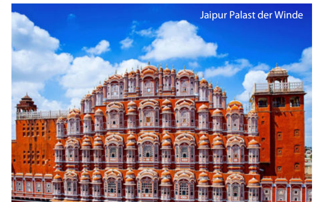
Jaipur Palast der Winde