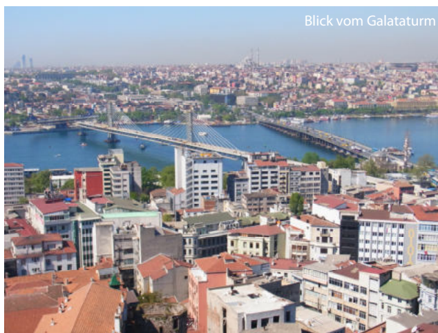
Blick vom Galataturm

Sollte die Mindestteilnehmerzahl nicht erreicht werden, kann der Veranstalter bis spätestens 30 Tage vor Reisebeginn vom Reisevertrag zurück treten.