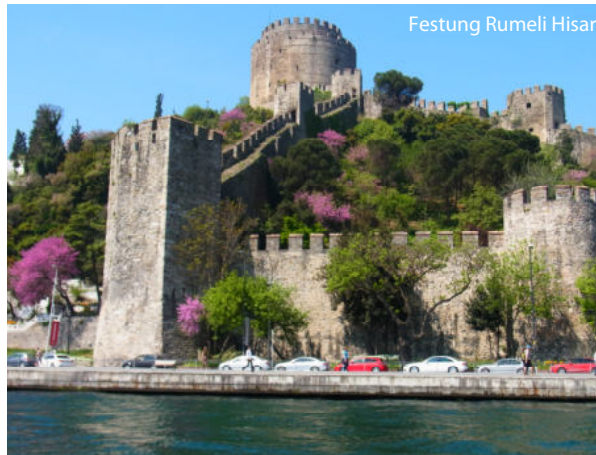
Festung Rumeli Hisari

Pascha, mit vielen Exponaten aus der Frühgeschichte der heutigen Türkei und aus islamischen Epoche ab dem 7. Jh. (Restaurierung in 2013, Wiedereröffnung vorauss. Mai 2014). Übernachtung in Istanbul.