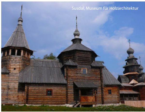
Susdal, Museum für Holzarchitektur

faltigkeit und des Heiligen Sergius (UNESCO Weltkulturerbe). Das Kloster ist geistiges Zentrum der Russisch-Orthodoxen Kirche. Beeindruckend ist die einmalig reiche Ausstattung der Kirchen und Kathedralen, u. a. die Dreifaltigkeits-Kathedrale und Maria-