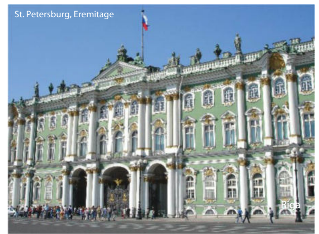
St. Petersburg, Eremitage

8. Tag: Am frühen Morgen Fahrt in der 2. Klasse mit dem Schnellzug „Sapsan“ nach St. Petersburg. Treffen mit der örtlichen Rei-