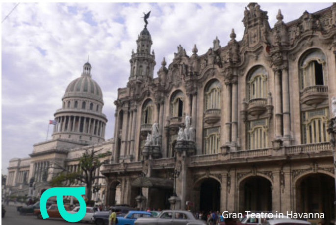
Gran Teatro in Havanna

Frühmorgens Fahrt auf der ‚Tabakroute‘ in Richtung Pinar del Rio zum malerischen Vinales. Unterwegs Halt bei einem Veguero (Tabakbauer) und Panoramatour durch das Mogote-Tal mit seinen bis zu 400m hohen, eng beieinander stehenden Kalksteinkegeln. Besuch der ‚prähistorischen‘ Mauer, einer imposanten Felsmalerei. Aufbruch zur Höhle ‚Cueva Santo Tomas‘, wo Sie eine Wanderung unternehmen. Die Höhle ist mit ca. 46 km das größte Höhlensystem Kubas. Sehenswert sind die Stalaktiten und Stalagmiten und die unterirdischen Seen. Rückfahrt nach Havanna. Abendessen im Restaurant La Divina Pastora mit einem herrlichen Blick über die Stadt. Übernachtung in Havanna.