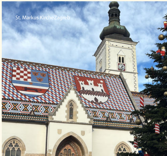
St. Markus Kirche Zagreb

Nicht enthalten sind Trinkgelder für Busfahrer und örtliche Reiseleitung, Gepäckträgerservice im Hotel und evtl. gewünschte zusätzliche Reiseversicherungen.